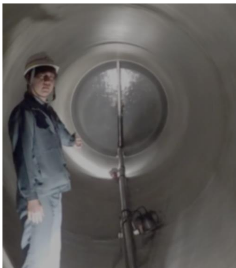
北光小学校 緊急貯水槽内部

近年頻発している自然災害により断水が長期化するケースが増えていることから、水を備蓄している人が増えていると思います。また、応急給水拠点について、市民の皆様を知っていただけるよう、今後情報発信に力をいれていきます！